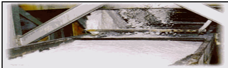
Figura 03: Refinamento do açúcar

Nas plantas, os açúcares são sintetizados para armazenar energias vitais, responsáveis pelo seu crescimento e maturação, enquanto o açúcar industrializado é sacarose, um dissacarídeo (união de dois monossacarídeos: a glicose e a frutose) que, quando ingerido, divide-se novamente em metade glicose e outra metade em frutose, proporcionando apenas calorias vazias, pois não contém qualquer nutriente. O refinamento do açúcar, mostrado na figura abaixo, propicia estética ao produto, numa clarificação química, transformando-o em solto e branco, no entanto, o destitui de sais minerais, proteínas, fibras e vitaminas.