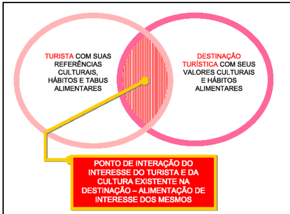
Figura 01: Relação intercultural gastronômica propiciada pelo turismo

donde historicamente se reconhece a feitura de determinado prato, conforme sugerido na figura apresentada a seguir.