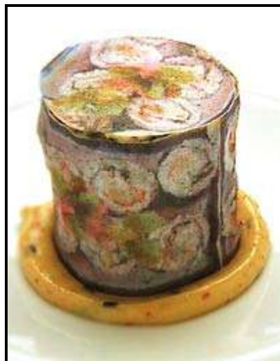
Figura 04: Sushi em embalagem comestível Fonte: (CORRÊA, 2005)

Muitos exemplos são apresentados nesta reportagem que investe em deixar claro o caráter científico das tecnologias a serviço da Gastronomia. Alguns merecem ser destacados para que se compreendam as interações entre Gastronomia, Física e a Química. O chef Homaro Cantu, do restaurante Moto em Chicago (USA), produz cardápios comestíveis, feitos à base de extratos vegetais, utilizando como recurso de reprodução uma impressora simples de jato de tinta. A figura a seguir corresponde ao sushi embrulhado em papel comestível à base de soja.