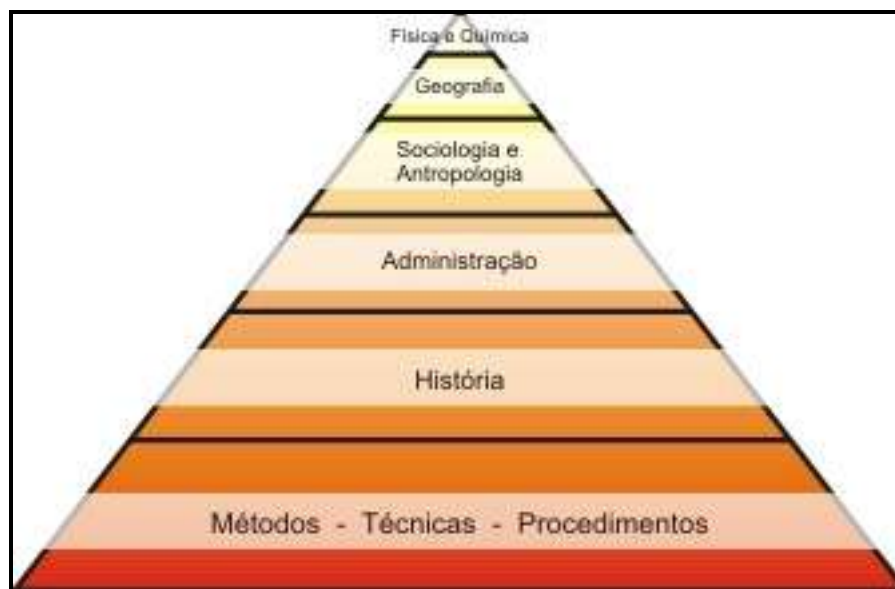
Figura 05: Pirâmide das áreas de interesse trabalhadas nos cursos de Gastronomia analisados

a predominância dos temas relativos a métodos, técnicas e procedimentos, seguidos pelos campos da História e da Administração. Menor importância ganham as abordagens da Sociologia e da Antropologia. Já o topo da pirâmide, que reúne os conteúdos de menor ênfase, é ocupado pela Geografia e, em menor proporção, pelos conhecimentos de Física e Química.